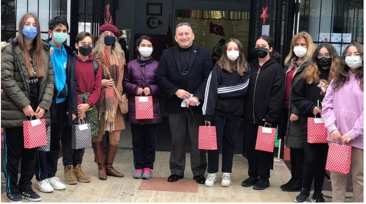
Şekil 6 ' Look Feel Learn'' isimli e-. twinning projesi 2021 yılında Ulusal Kalite Etiketi ve Avrupa Kalite Etiketi ödülleriyle taçlanmıştır.