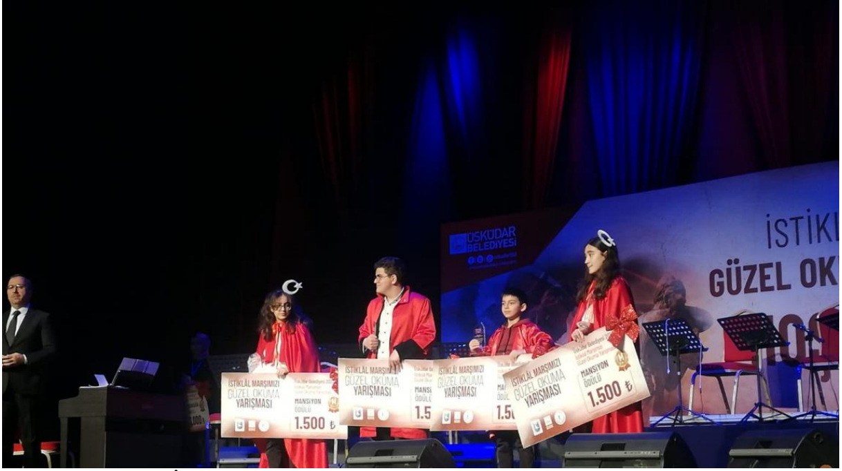
Şekil 412 Mart İstiklal Marşını Güzel Okuma Yarışmasında öğrencimiz mansiyon ödülü kazanmıştır.