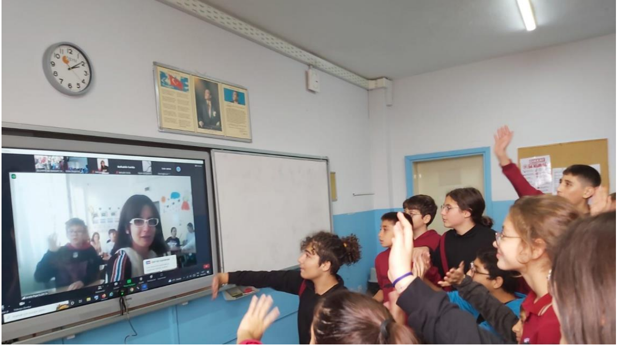
Şekil 9 "Small Steps Big Goals" isimli eTwinning projemizin partner ortakları Fransa ve Romanya'nın öğrencileriyle tanışma toplantımızı gerçekleştirdik