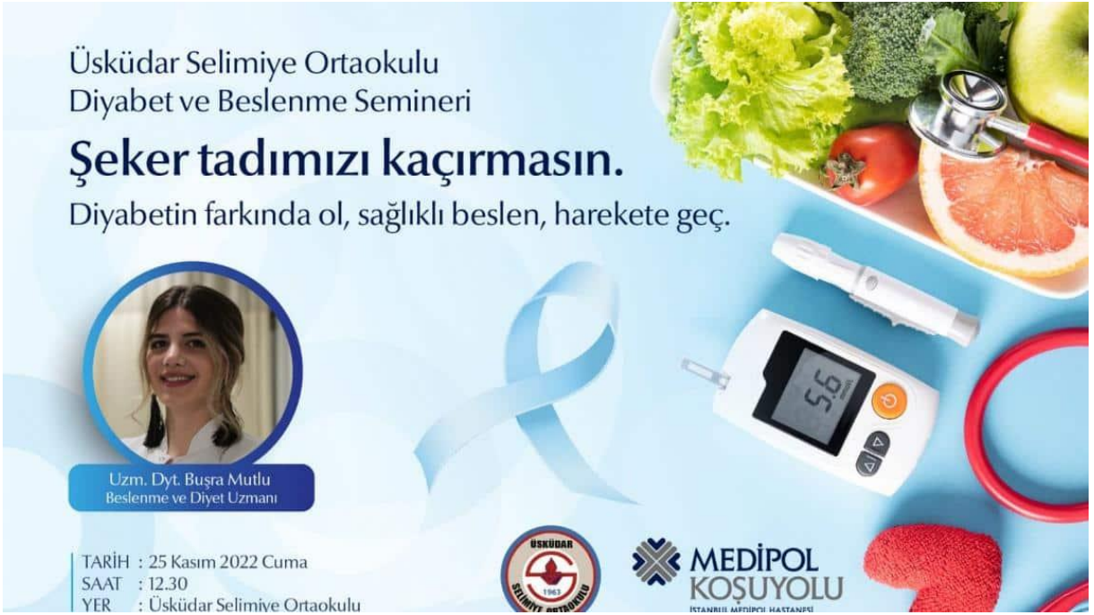
Şekil 16 DIYABET VE BESLENME SEMINERİ