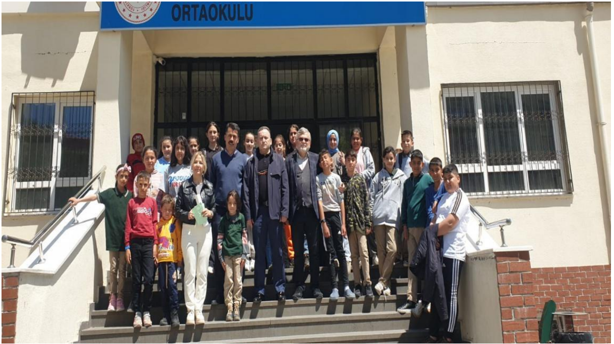
Şekil 14 Okul müdürümüz, okul aile birliğimiz ve bir öğretmenimizle Kahramanmaraşın Onikişubat ilçesindeki kardeş okulumuz Klavuzlu Abdulgani Seyithanoğlu ziyareti.