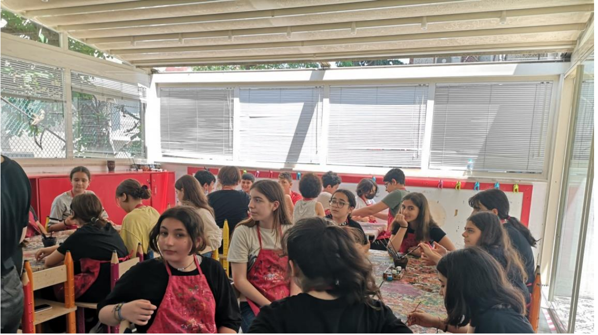
Şekil 18 İstanbul Oyuncak Müzesine ve Oyuncak Yapım Atölyesine gidildi.