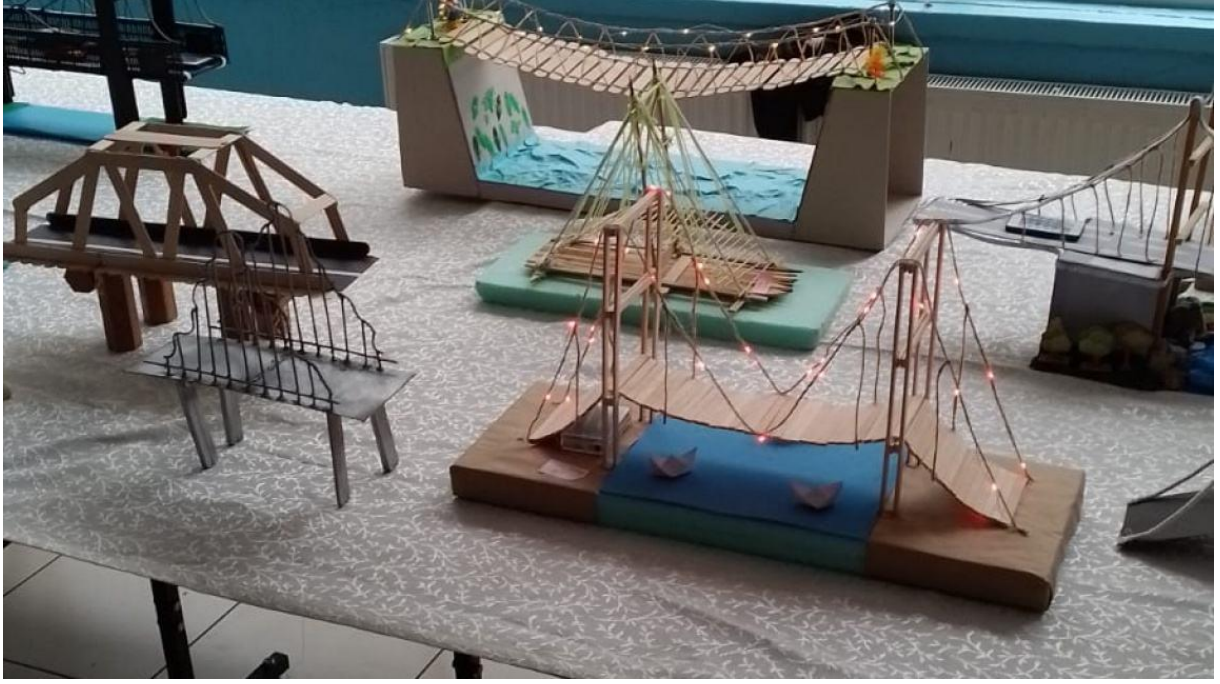
Şekil 13 Teknoloji Tasarım Dersi sene sonu sergimiz.