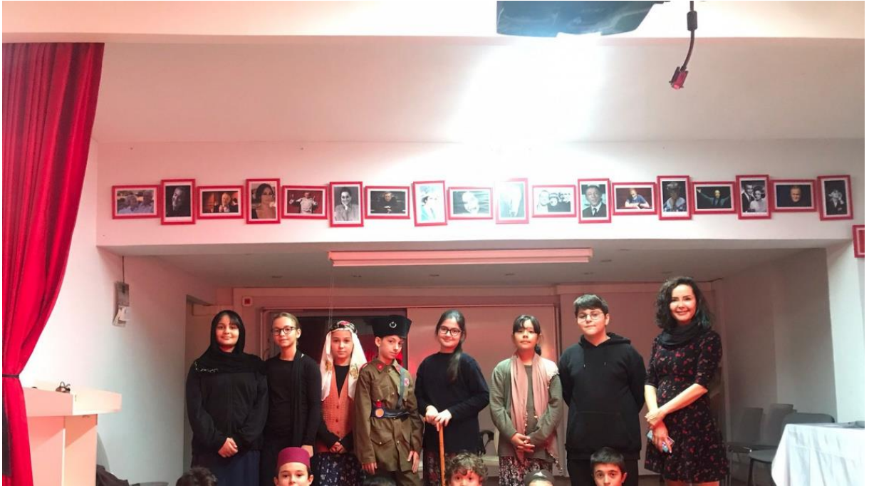
Şekil 10 5.sınıf öğrencilerimiz Cumhuriyet bayramımızı kutlamak için "Cumhuriyet" isimli bir oyun hazırlamışlardır