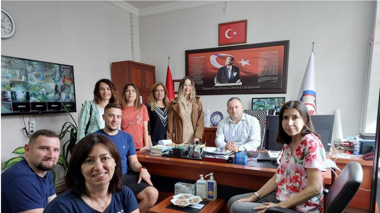
Şekil 8 26-30 Eylül 2022 tarihleri arasında " Together against the pandemic - obstacle or challenge " isimli Erasmus+ KA122-SCH-000041946 proje kapsamında Polonya'dan gelen öğretmen misafirlerimizi ağırladık.