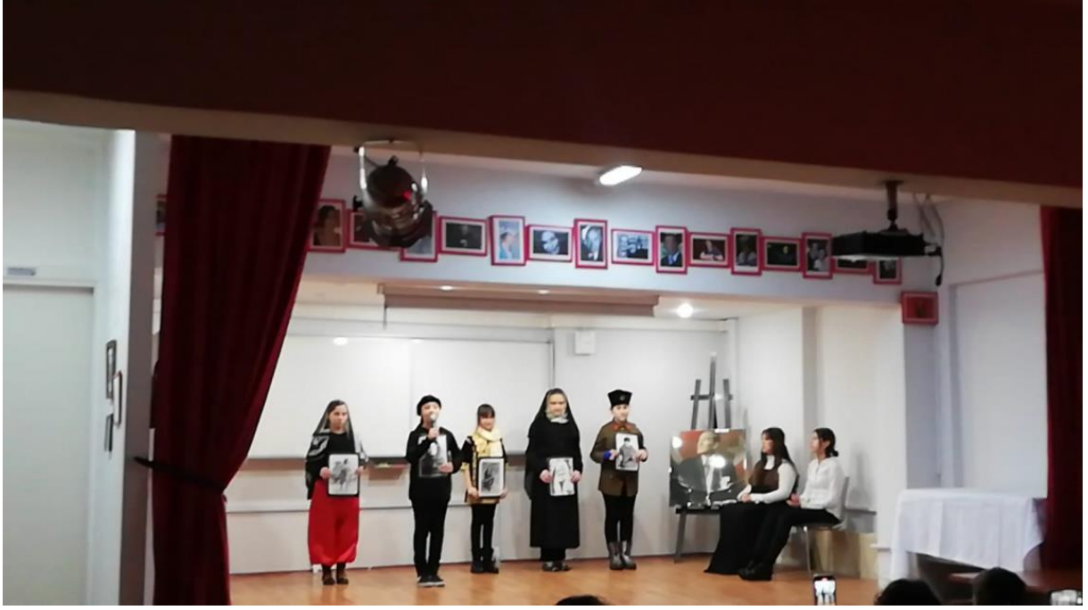
Şekil 15 Çanakkale 18 Mart Deniz Zaferi ve Şehitleri Anma Günü.