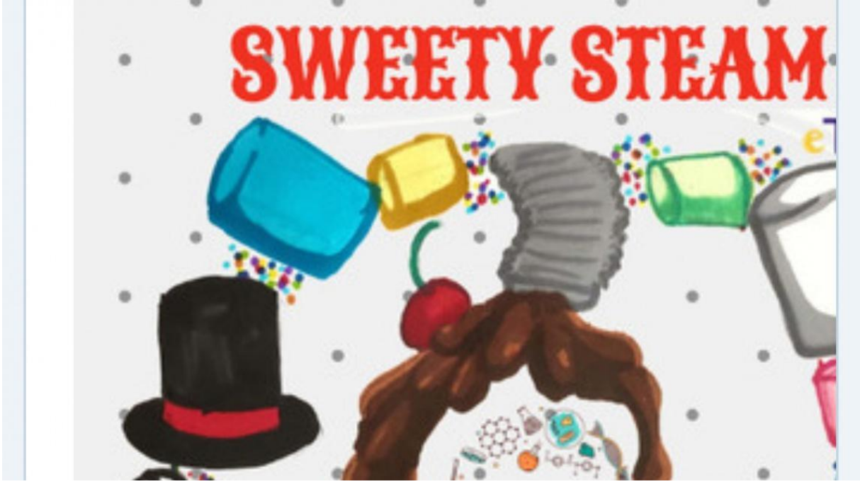
Şekil 7 Okulumuzun katıldığı SWEETY STEAM e-twinning projesinde , okulumuz 7/B sınıfı öğrencisi Athena CANBAY yurt dışı dahil 19 okul olmak üzere , e-twinning proje logosu yarışmasında birinci olmuştur.