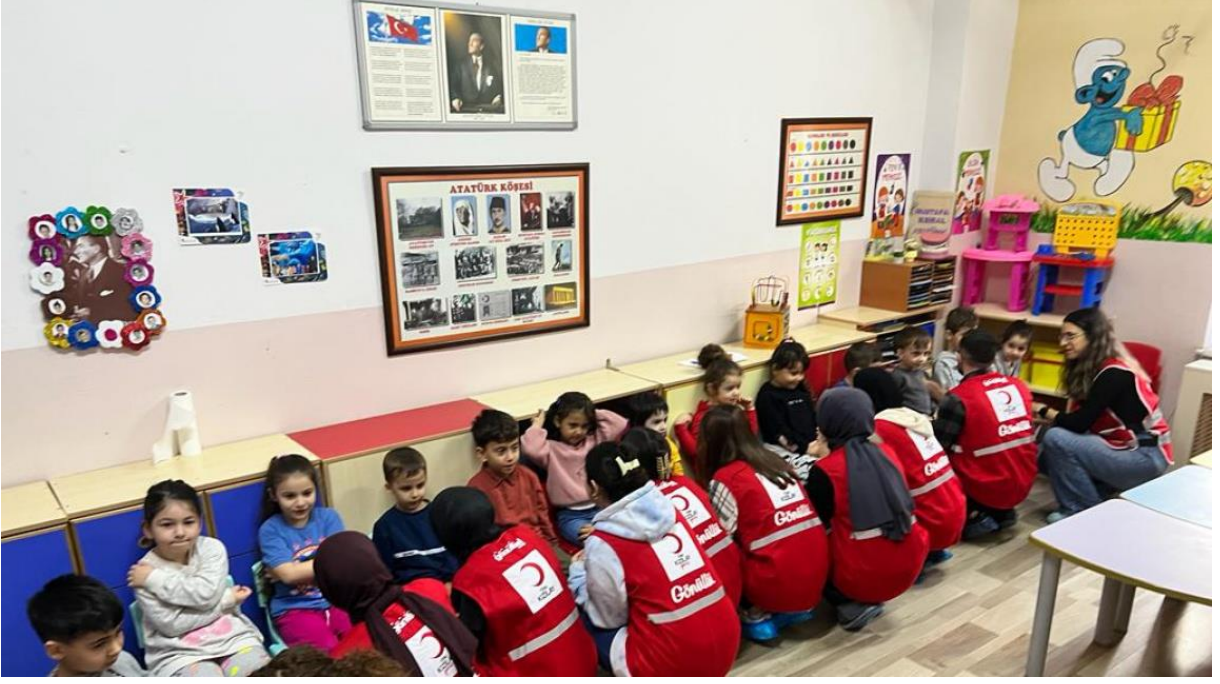
Şekil 17 Kızılay Haftasında Sağlık Bilimleri Üniversitesi öğrencilerinin katkılarıyla anaokulumuzda eğitici eğlenceli etkinlikler düzenlendi.