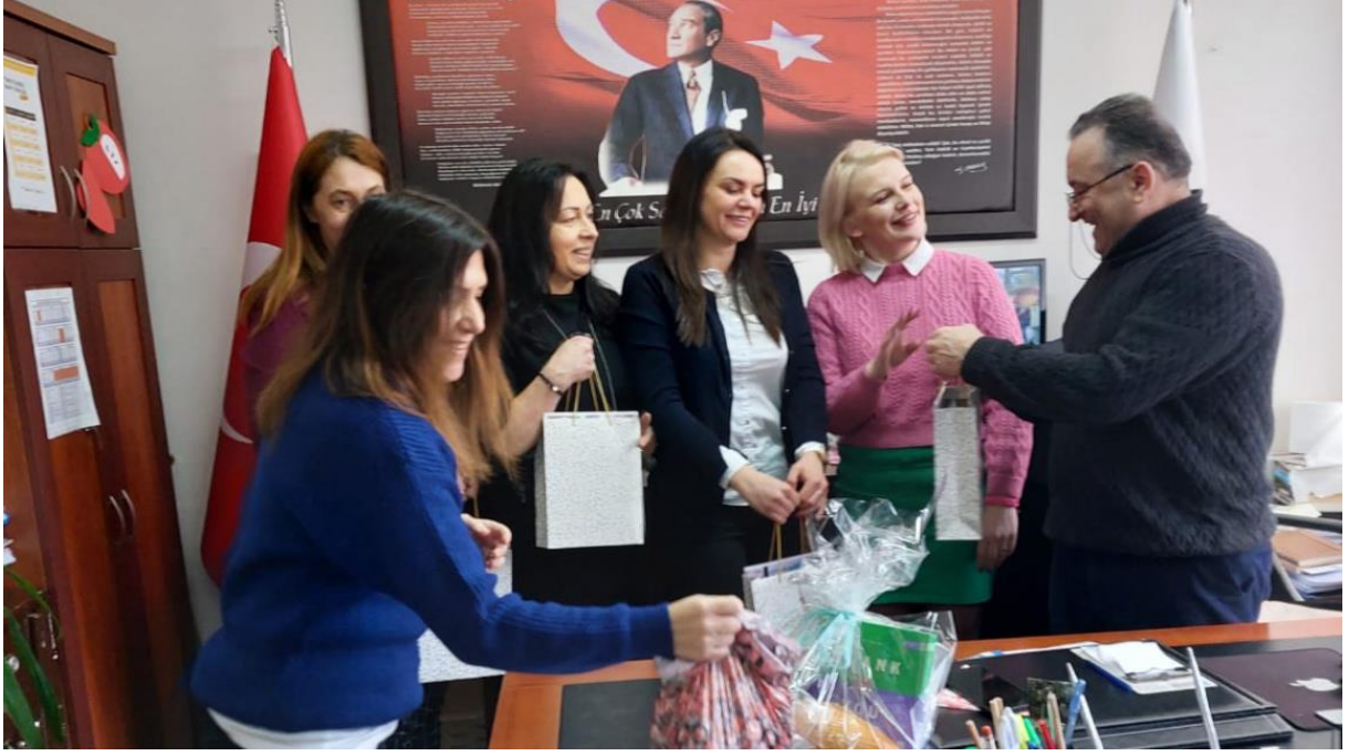
Şekil 11 Erasmus Projesi kapsamında Polonyalı meslektaşlarımızın ziyareti.