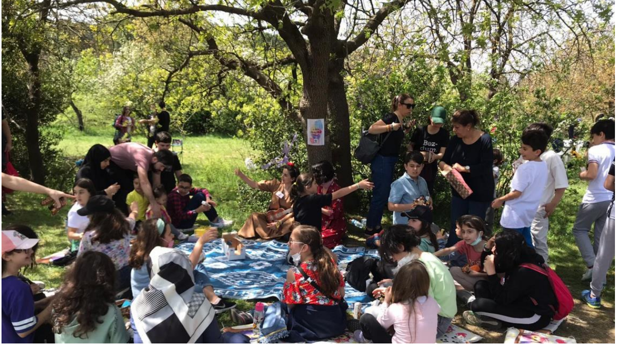
Şekil 195-B sınıfı ile Validebağ korusunda masal dinletisi etkinliğine katıldık.